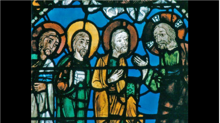
Glas in loodraam van Jezus met Zebedeüs en zijn zonen Jacobus en Johannes Marcus 10 vers 35 Raam in de Oud-Katholieke kerk van de H.H. Anna en Maria te Haarlem